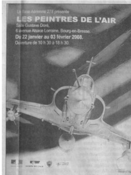
L'affiche de l'exposition témoigne du talent du « peintre de l'Air » ambarrois qui l'a réalisée