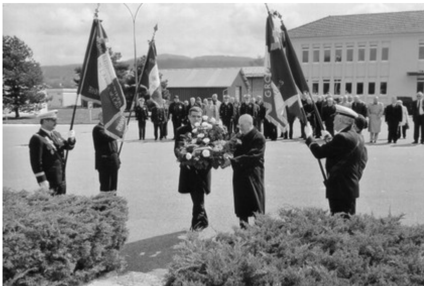
Assemblée générale du secteur 640 à Ambérieu